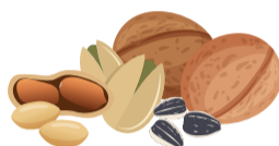
ОРЕХИ И СЕМЕНА