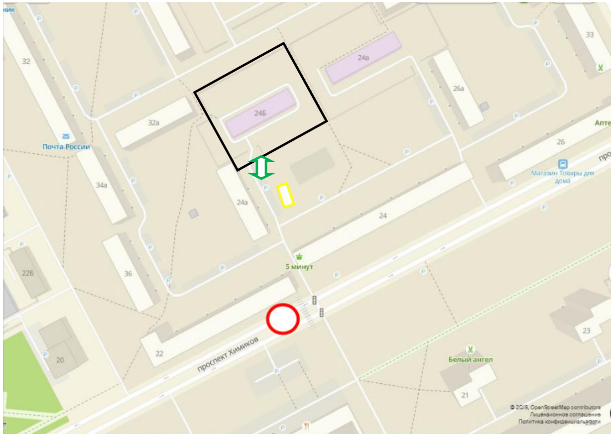
СХЕМА Организация дорожного движения в непосредственной близости от образовательной организации